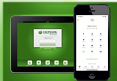
Мобильное приложение Сбербанк онлайн (планшет, смартфон)