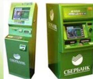
Устройства самообслуживания (банкоматы, терминалы)